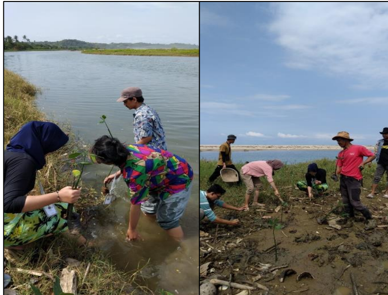
Gambar 4. Proses penanaman mangrove.

cukup keras maka harus dibuat lubang terlebih dahulu untuk memasukan benih, dengan ilustrasi pada Gambar 4.