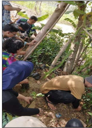
Gambar 2. Persiapan bibit mangrove.