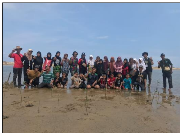
Gambar 5. Foto bersama dengan pemuda karang taruna, tokoh masyarakat, mahasiswa, dan anak-anak pengajian Al-Jihad.

Setelah penanaman mangrove selesai dilakukan, selanjutnya dilakukan serah terima kepada warga desa melalui pihak karang taruna agar tanaman mangrove dapat dipelihara dan dijaga bersama. Keberhasilan kegiatan penanaman bergantung dari kegiatan pemeliharaan mangrove oleh warga serta dapat menimbulkan kesadaran masyarakat untuk menjaga dan memelihara mangrove yang telah ditanam.