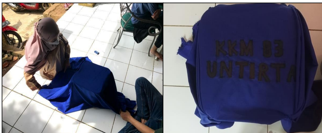
Gambar 4. Proses pemasangan sarung kursi dari Ecobrick .

Pelatihan pembuatan ecobrick pada masyarakat Desa Tegalwangi telah dilaksanakan dan mendapatkan respon positif di masyarakat. Kegiatan ini hanyalah sebagai awalan dan pembuka untuk memacu kreatifitas masyarakat dalam memanfaatkan sampah plastik.