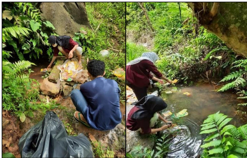
Gambar 2. Pencucian sampah plastik.

sampah plastik, sehingga dapat dipastikan kegiatan pelatihan ecobrick dapat dilaksanakan di Desa Tegalwangi. Pembagian tugas untuk tim mahasiswa pun dilaksanakan. Pada pelatihan ecobrick , dilakukan pembuatan kursi dari sampah plastik. Kegiatan pelatihan dimulai dengan pengambilan sampah plastik yang masih bisa digunakan untuk pelatihan ecobrick . Sampah plastik diambil satu persatu dan dikumpulkan (bungkus plastik kresek, bungkus mie instan, bungkus sabun deterjen, dan bungkus minyak goreng). Setelah terkumpul sesuai dengan estimasi yang dilakukan tim, sampah plastik di cuci terdahulu. Dokumentasi kegiatan pengumpulan sampah plastik dapat dilihat pada Gambar 2.