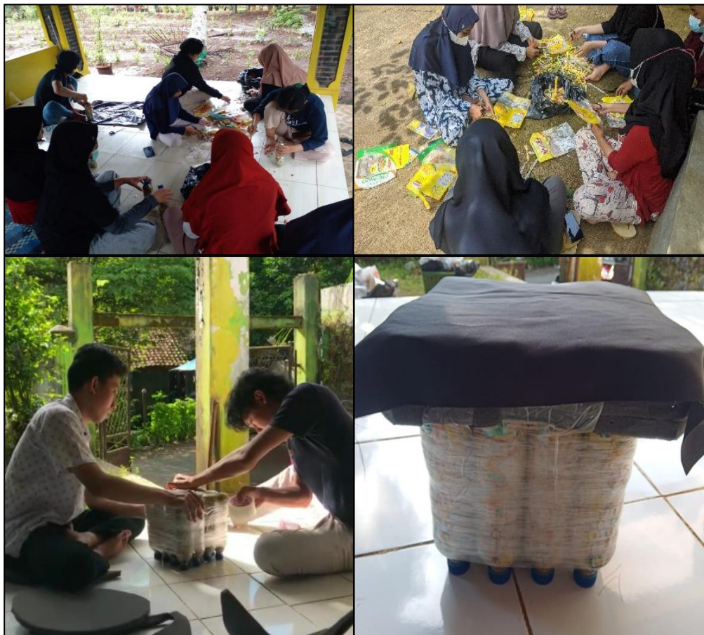
Gambar 3. Pengguntingan sampah plastik dan proses memasukkan ke dalam botol.