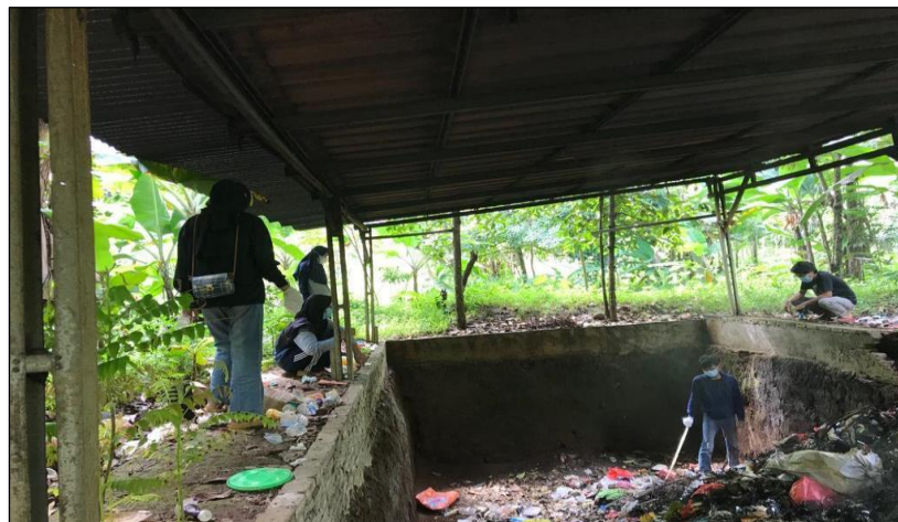
Gambar 1. Survei ke tempat pembuangan sampah Desa Tegalwangi.

Kegiatan Pengabdian Kepada Masyarakat di mulai pada bulan Januari 2022. Salah satu kegiatan yang dilakukan adalah pelatihan pembuatan ecobrick . Pada kegiatan pelatihan pembuatan ecobrick dimulai dengan koordinasi perizinan kegiatan dengan pihak Desa Tegalwangi. Setelah mendapatkan ijin, tim mengadakan survei serta mengunjungi tempat pembuangan sampah yang dimiliki oleh Desa Tegalwangi. Dokumentasi survei dapat dilihat pada Gambar 1.