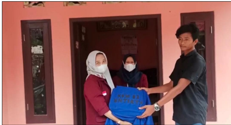
Gambar 5. Penyerahan simbolis kursi dari Ecobrick .