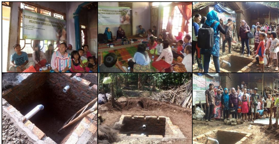
Gambar 1. Rangkaian kegiatan pengabdian pembuatan sumur resapan.