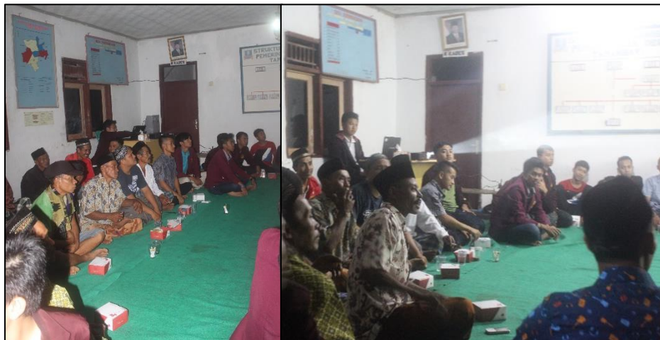
Gambar 3. Sosialisasi konservasi vegetatif oleh narasumber.

Dengan menanam pohon dapat mempengaruhi proses infiltrasi air hujan ke dalam tanah dimana hal ini merupakan indikator konservasi air. Pada kondisi dan situasi tertentu di musim kemarau pohon mahoni menggugurkan daun, hal tersebut mempengaruhi transpirasi guna melindungi keseimbangan air [16]. Manfaat lain yang bisa diperoleh dengan adanya tanaman konservasi salah satu diantaranya dapat menambah penghasilan dengan memanfaatkan kulit, daun, buah serta biji sebagai bahan obat-obatan serta pakan ternak [18].