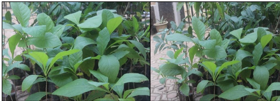
Gambar 2. 120 Bibit pohon yang ditanam pada kegiatan konservasi vegetatif Desa Tamansari.

mahoni telah tumbuh besar. Pohon jati dapat tumbuh di wilayah musim kering dengan tanah bertekstur sedang pH netral sampai asam [17]. Sebanyak 120 bibit pohon (Gambar 2) diperoleh dari Dinas Kehutanan dan Perkebunan Provinsi Banten untuk kegiatan KKM dan pengabdian masyarakat, terdiri dari jati bongor ( Anthocephalus cadamba ), mahoni ( Swietenia mahagoni ), kayu manis ( Cinnamomum verum ), kayu ulin ( Eusideroxylon zwageri ), dan sengon ( Albizia chinensis ). Arah konservasi pada kegiatan KKM dan pengabdian masyarakat adalah dengan penyuluhan pada masyarakat (Gambar 3) sebagai bentuk nyata melindungi eksistensi serta keberlanjutan mata air Cinyusu agar tetap tersedia baik mutu serta kapasitas debit.