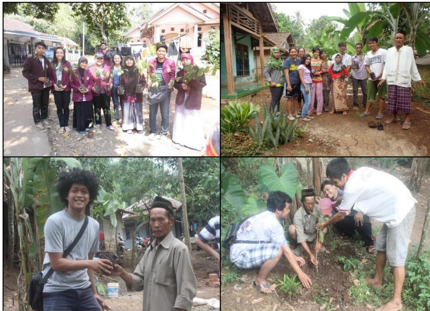
Gambar 4. Kegiatan konservasi bersama Masyarakat Desa Tamansari.

Bibit pohon yang didapatkan Dinas Kehutanan dan Perkebunan Provinsi Banten yang berlokasi di Gunung Pinang (Jl. Raya Serang-Cilegon) selanjutnya bibit tersebut diserahkan kepada masyarakat untuk ditanam dan dipelihara (Gambar 4). Pohon yang ditanam merupakan jenis pohon yang tumbuh dengan akar yang kuat dan mampu menyerap air jauh lebih. Air dari permukaan tanah akan lebih mudah diserap oleh akar pohon ke dalam tanah dan menciptakan kondisi ideal untuk kelestarian mata air.