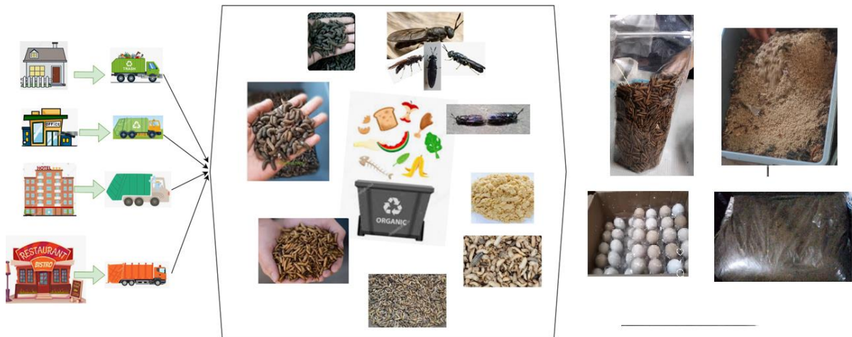
Gambar 3. Alur proses sampah organik menjadi nilai tambah bagi masyarakat

untuk pakan burung kicau. Pondok BSF juga menghasilkan kompos organik dan telur ayam kampung.