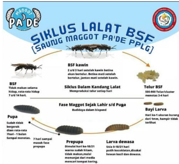
Gambar 1. Siklus Lalat BSF