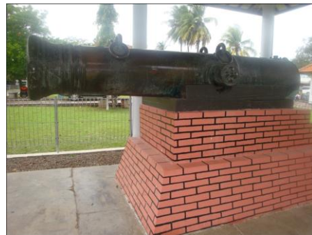
Meriam Ki Amuk yang sekarang berada di Museum Situs Keperbukalaan Banten Lama