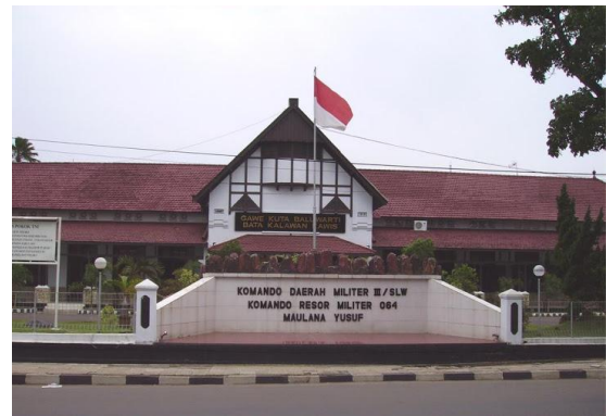
Markas Korem064/Maulana Yusuf terletak di Jalan Maulana Yusuf, Kota Serang, di bagian depan bangunan terdapat tulisan gawe kuta baluwarti bata kalawan kawis

Contoh dari tindakan simbolis, gawe kuta baluwarti bata kalawan kawis digunakan oleh Komando Resor Militer (Korem) 064/Maulana Yusuf sebagai motto. Sebagaimana yang telah diulas paragraf sebelumnya, meski alat pertahanan modern sudah tidak menggunakan benteng yang terbuat dari bata dan karang, namun ide/gagasan dari masa lampau tetap digunakan sebagai spirit yang memberi harapan bagi masa depan lebih baik.