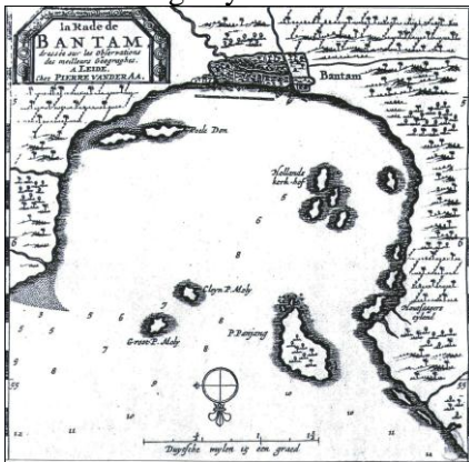
Peta yang dibuat orang Eropa ini menggambarkan Teluk Banten di pesisir utara pada Masa Kesultanan

Penyediaan sumber daya tanah liat untuk pembuatan batu bata berada di dekat atau daerah aliran Sungai Cibanten (Heriyanti O.Untoro, 1997). Selain tanah liat, sumber daya yang banyak pula digunakan untuk pembangunan Bandar Banten ialah batu andesit. Jenis material ini banyak pula digunakan sebagai bahan baku peralatan rumah tangga, seperti lumpang batu, peluru, nisan makam dan sebagainya.