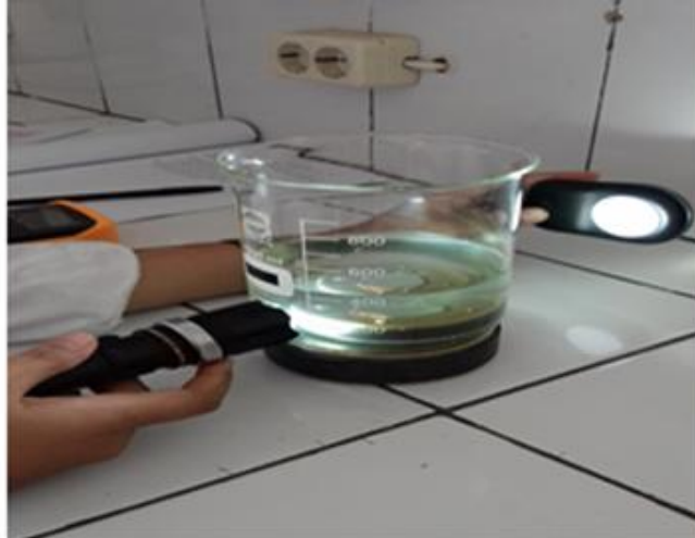
Gambar 2. Pengukuran intensitas cahaya pada medium air yang dipengaruhi medan magnet

L2 (intensitas cahaya pada saat gelas beker terisi air dan terdapat magnet didalamnya) gelas beker diisi dengan air serta pada bagian alas gelas beker terdapat magnet yang berada