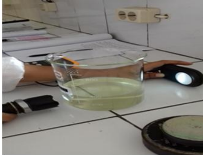
Gambar 1. Pengukuran intensitas cahaya pada gelas beker berisi air tanpa pengaruh medan magnet

besar dan kecil, senter dan stopwatch ) serta bahan (air kolam, air sungai, air tanah, air PAM dan air selokan).