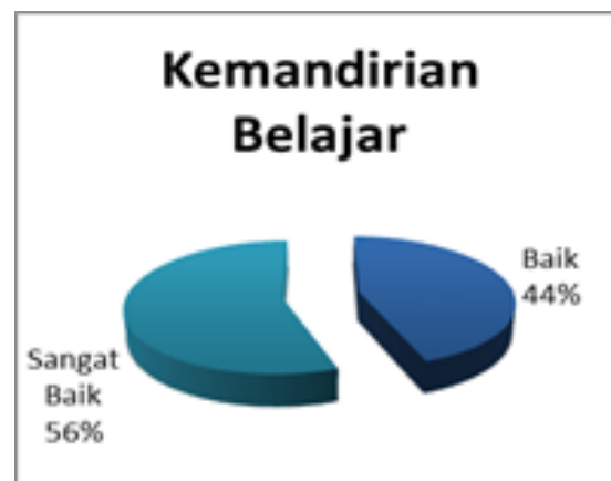
Gambar 2. Hasil Data Kemandirian Belajar

dengan menggunakan media berbasis virtual laboratory menggunakan pendekatan mini laboratory, mahasiswa dituntut untuk mandiri dalam hal pembuatan media virtual dengan menggunakan macromedia flash .