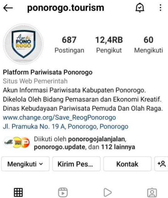
Gambar 2. Tampilan Profil Akun Instagram @ponorogo.tourism Sumber : Akun Instagram @ponorogo.tourism

performance assessment diukur dari perencanaan publikasi postingan yang terhitung dalam sehari.