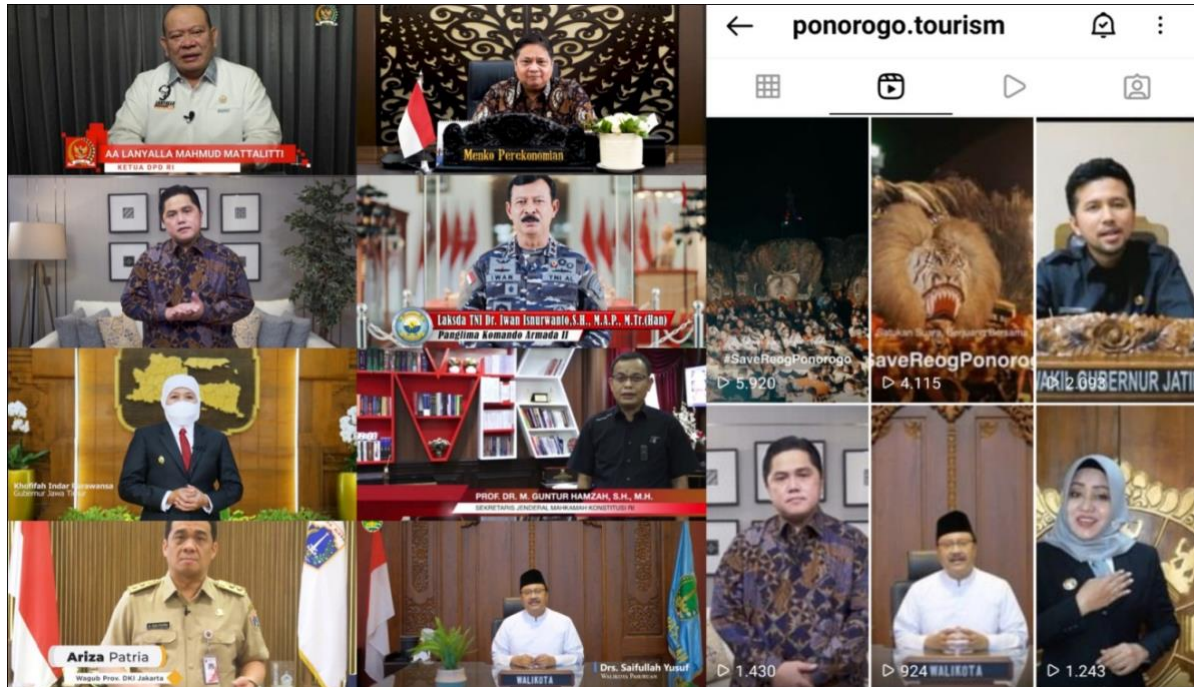
Gambar 5. Tangkapan Layar Video Dukungan Tokoh Penting

online via Email . Tujuan utamanya mengajak untuk memberikan dukungan secara nyata berupa foto, audio, maupun hal lainnya.