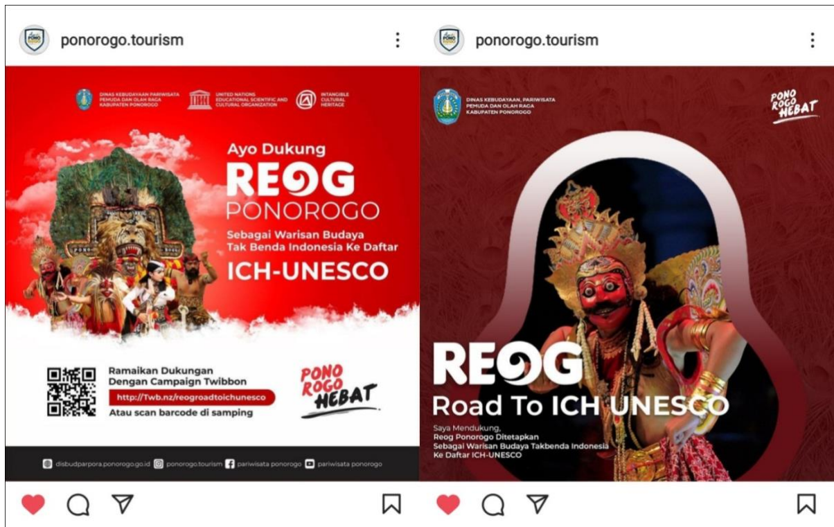
Gambar 3. Postingan Ajakan untuk Menggunakan Twibbon

Dalam hal ini, peran masyarakat sangat penting karena dengan keterlibatan mereka dalam agenda penting pemerintah menjadi suatu bentuk apresiasi terhadap kesenian yang sudah berakar di Ponorogo yaitu Reog Ponorogo. Dengan adanya suatu campaign yang dibuat pihak pemerintah, diharapkan dapat menstimulus keterlibatan masyarakat untuk membantu dan mendukung dalam pencatatan Reog secara offline dengan menggelar penampilan Reog atau biasanya dikatakan masyarakat lokal dengan "Reogan" atau secara online dengan dimulai dari hal-hal kecil seperti share poster, like , komentar, speak up