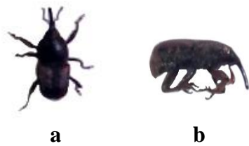
Gambar 2. Imago S. zeamais (a) hidup dan (b) mati

dan mati akibat pemberian tepung biji mengkudu dapat dilihat pada Gambar 12.