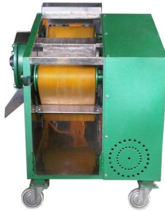
Gambar 3. Mesin Suritech™

menempel pada tulang/kulitnya, maka tulang/kulit tersebut dapat digiling kembali hingga benar-benar bersih.