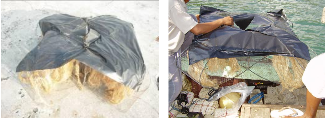
Gambar 1. Atraktor cumi-cumi

terbuat dari bambu, dan 85% telur yang ditetaskan di KJA dapat bertahan hidup. Dengan demikian penggunaan atraktor cumi-cumi sebagai salah satu TTG perikanan tangkap sangat efektif untuk menjaga kelangsungan dan ketersediaan cumi-cumi di suatu perairan (Baskoro et al. , 2008).