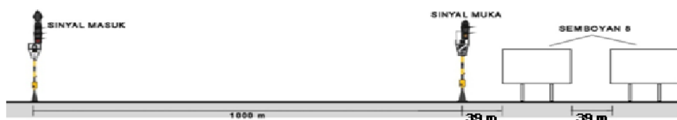
Gambar 4. Skema Jarak Semboyan 8 terhadap Sinyal