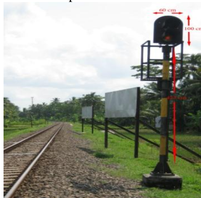
Gambar 3. Papan Semboyan 8 dan Sinyal Muka Stasiun Langen

mulai mengerem tepat di sinyal muka, Kereta Api tidak akan melewati sinyal masuk atau tidak terjadi pelanggaran sinyal. Jarak sinyal masuk ke wesel paling ujung dari arah Yogyakarta yaitu 360 m, lebih panjang daripada jarak pengereman Kereta Api pada kecepatan 70 hingga 40 km/jam, baik jarak hasil perhitungan maupun simulasi, sehingga saat Kereta Api melewati sepur belok pada wesel kemungkinan tidak akan keluar rel. Jarak sinyal masuk ke wesel paling ujung dari arah Bandung yaitu 355 m. Pada hasil perhitungan, jarak pengereman Kereta Api dari arah Bandung lebih pendek daripada jarak sinyal masuk ke wesel paling ujung. Tetapi, jarak pengereman Kereta Api dari arah Bandung berdasarkan hasil simulasi, lebih panjang daripada jarak sinyal masuk ke wesel paling ujung sehingga dikhawatirkan Kereta Api akan terlempar keluar rel saat melewati sepur belok pada wesel karena kecepatannya melebihi batas yang direkomendasikan, yaitu 40 km/jam.