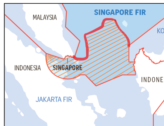
Figure 2: Post to FIR 2022

One important point outlined in the 2022 realignment agreement is the revision of the Jakarta FIR boundaries, covering the entire territorial expanse of Indonesia.