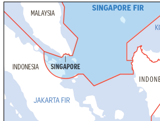
Figure 1: Prior to FIR 2022

services for a section of this realigned airspace to Singapore for 25 years, with the potential for extension. 6