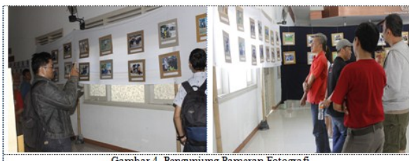
Gambar 4. Pengunjung Pameran Fotografi

pengunjung pameran pada hari pertama yaitu tanggal 29 Juli 2016 sebanyak 58 pengunjung yang berasal dari mahasiswa, dosen, siswa siswi dari Kota Mataram, Federasi Seni NTB, dan alumni IKIP Mataram. Sementara hari ke dua, tanggal 30 Juli 2016 pengunjung berjumlah 32 orang yang berasal dari mahasiswa, dosen, siswa-siswi SMA dan SMK sekitar Kota Mataram, dan alumni IKIP Mataram. Berikut adalah gambar pengunjung pameran fotografi: