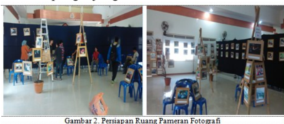
Gambar 2. Persiapan Ruang Pameran Fotografi

Pameran fotografi Prodi Teknologi Pendidikan menggunakan ruangan Aula Handayani milik IKIP Mataram. Sebelum ruang tersebut digunakan untuk pameran, terlebih dahulu panitia pameran fotografi meminta izin dengan izin resmi. Ruang pameran di Aula Handayani IKIP Mataram ditata semenarik mungkin agar mendapatkan suasana pameran yang terkesan unik dan menarik sehingga dapat menarik pengunjung dari luar.